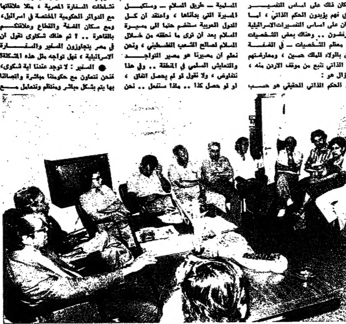
جانب من لقاء أسرة «الانباء» بسفير مصر

على العجبات التي كانت تعترض استئناف المفاوضات لتطبيق الحكم الذاتي الكامل في الضفة الغربية وتطاع غزة .. والحقيقة انه كان هناك ما يستوجب وقفاً لأسباب يعرفها الجانبان ، وان كان البعض قد رأى انه لم يكن بيننا على الرئيس السادات ان يعلن وقف هذه المفاوضات ، فان من اكب مسيرة السلام يعرف الأسباب التي امتدت الى اتخاذ هذه الخطوة وانه لم يكن اي تقدم ملموس في الموضوع ، ومع ذلك فالرئيس السادات أعلن في خطابه يوم الرابع عشر من ايار قبله استئناف هذه المفاوضات ثم فرجه في اليوم التالي بالترهلة مسألة حساسة وهي «القدس الشرقية» وهذه المسألة - وكعربي - اعترف بقبحها هامة للعرب والمسلم الاسلامي اجمع ، ومن الممكن ان حل لها كثيراً من المشاكل اذا ما صحت التروايب ، وحتى توفر الامتثال - ولنا دخل هنا في تفاصيل الحل - ومن هنا تركيزي على تفسير الشخصية لتفكير الامن الإسرائيلي الذي تعرض له من وجهة نظري .. فالامن الإسرائيلي لا يعتمد بالدرجة الأولى على المستوطنات ولا على القوة العسكرية ، بل يعتمد على عدة عوامل اخرى اولها التوازن الدولي ، واحتلال السلام مع مصر ، واقامة مصالح متبادلة .. ونحن نعلم ان استردادنا قسماً كبيراً من سيناء ونحن في صدد استرداد القسم الباقي ان شاء الله .. ومن ضمن عوامل الامن ايضا ، فقد تباعد في خلق مصالح متبادلة وتكون مثل هذه المصالح نتيجة للثقة ، وتزويج بزيدي من الثقة التي اذا توترت فلا داعي للمستوطنات والاحتلال او لاجراءات كثيرة تغير مظاهر العرب والعالم ، وتختلف القوانين الدولية ، والاتفاقيات جنيف ، ونسيه الى مركب اسرائيل على الصعيد الدولي .